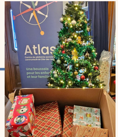
Opération Père Noël