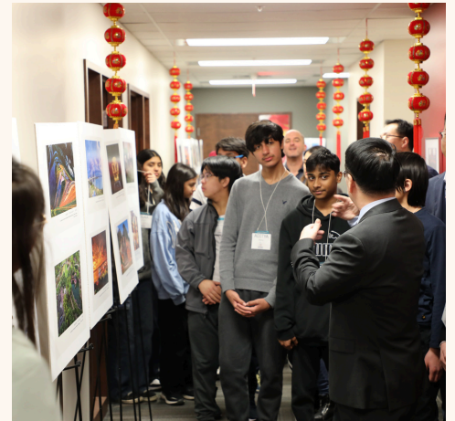
Visite du consulat de Chine