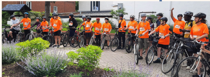
Tour de l'île