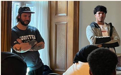
Visite des Alouettes