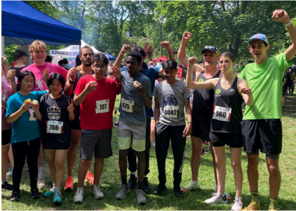
Foulée des parcs