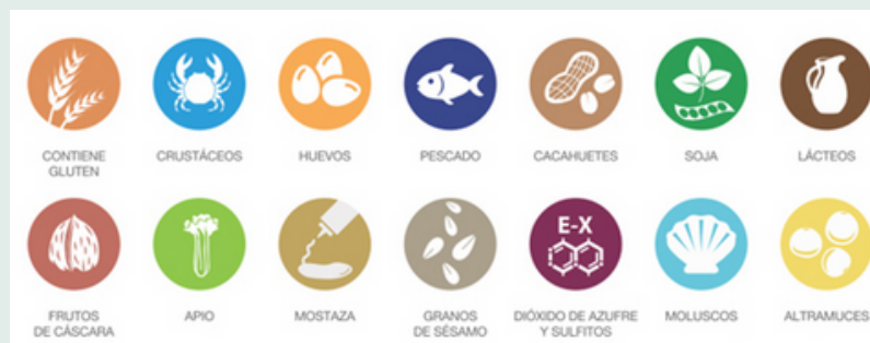
TABLA DE ALÉRGENOS

Algunos alimentos pueden contener trazas de gluten. Para información de alérgenos consulte con nuestro personal