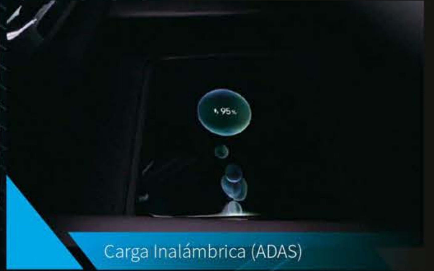
Carga Inalámbrica (ADAS)