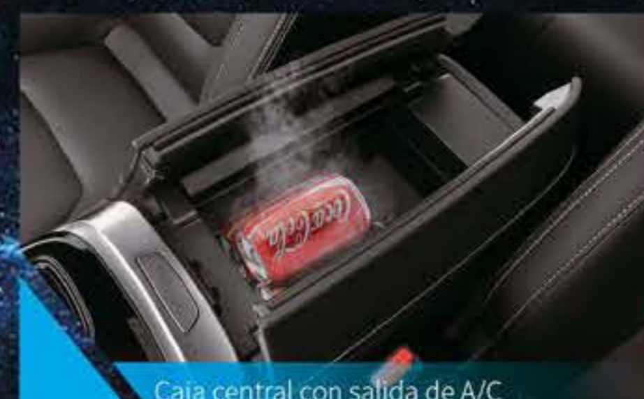
Caja central con salida de A/C