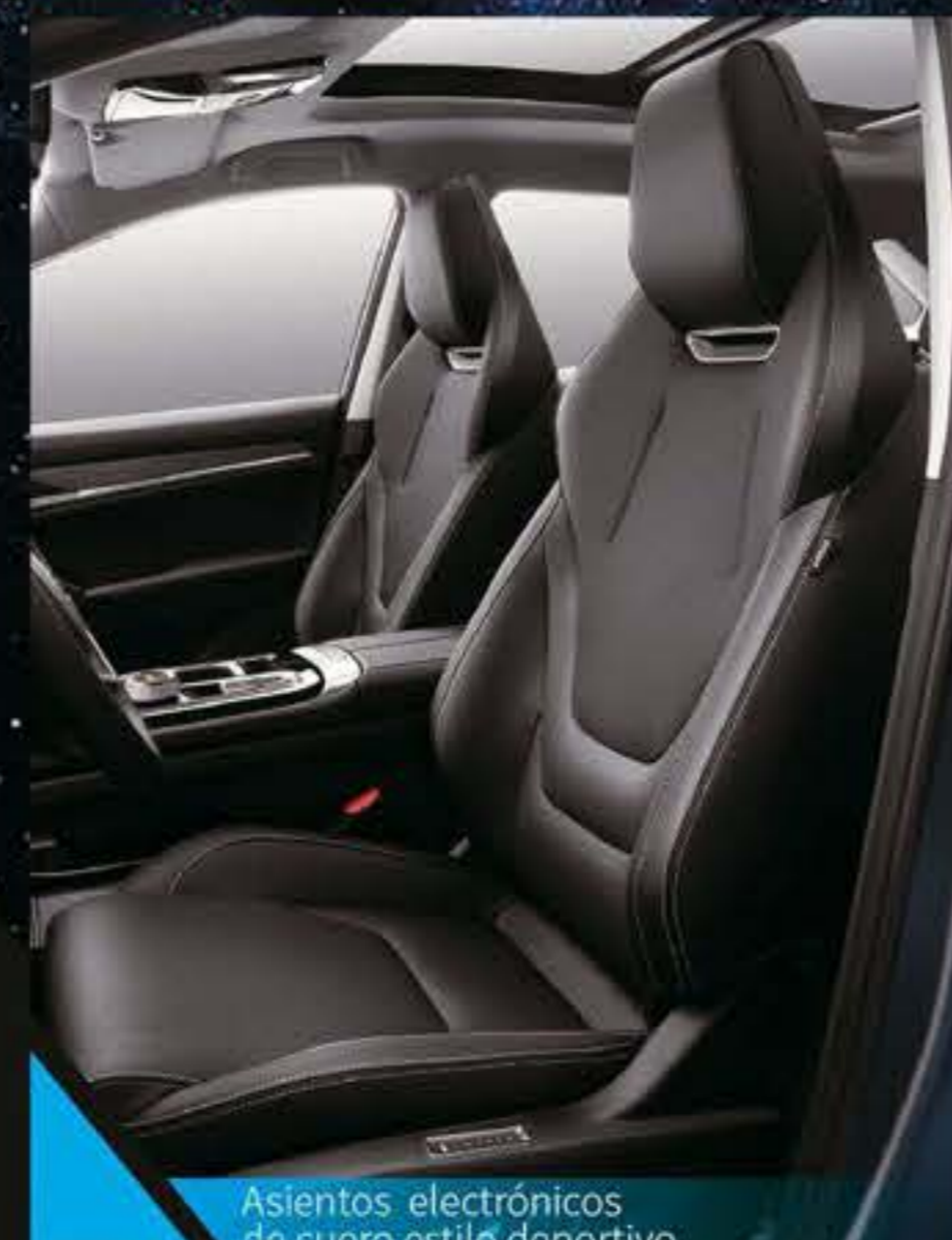
Asientos electrónicos de cuero estilo deportivo