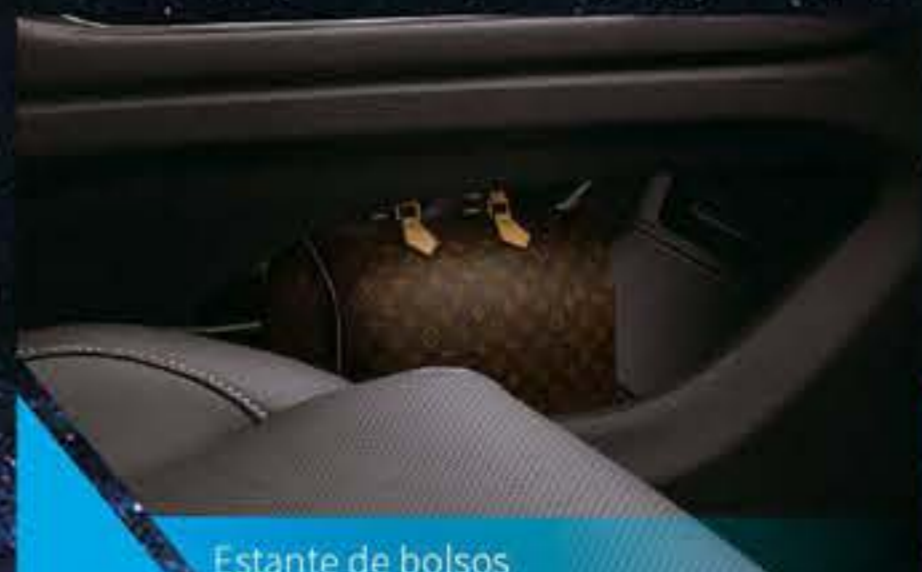
Estante de bolsos