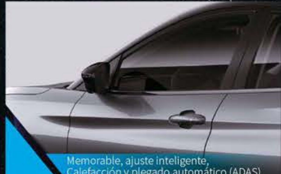
Memorable, ajuste inteligente, Calefacción y plegado automático (ADAS)