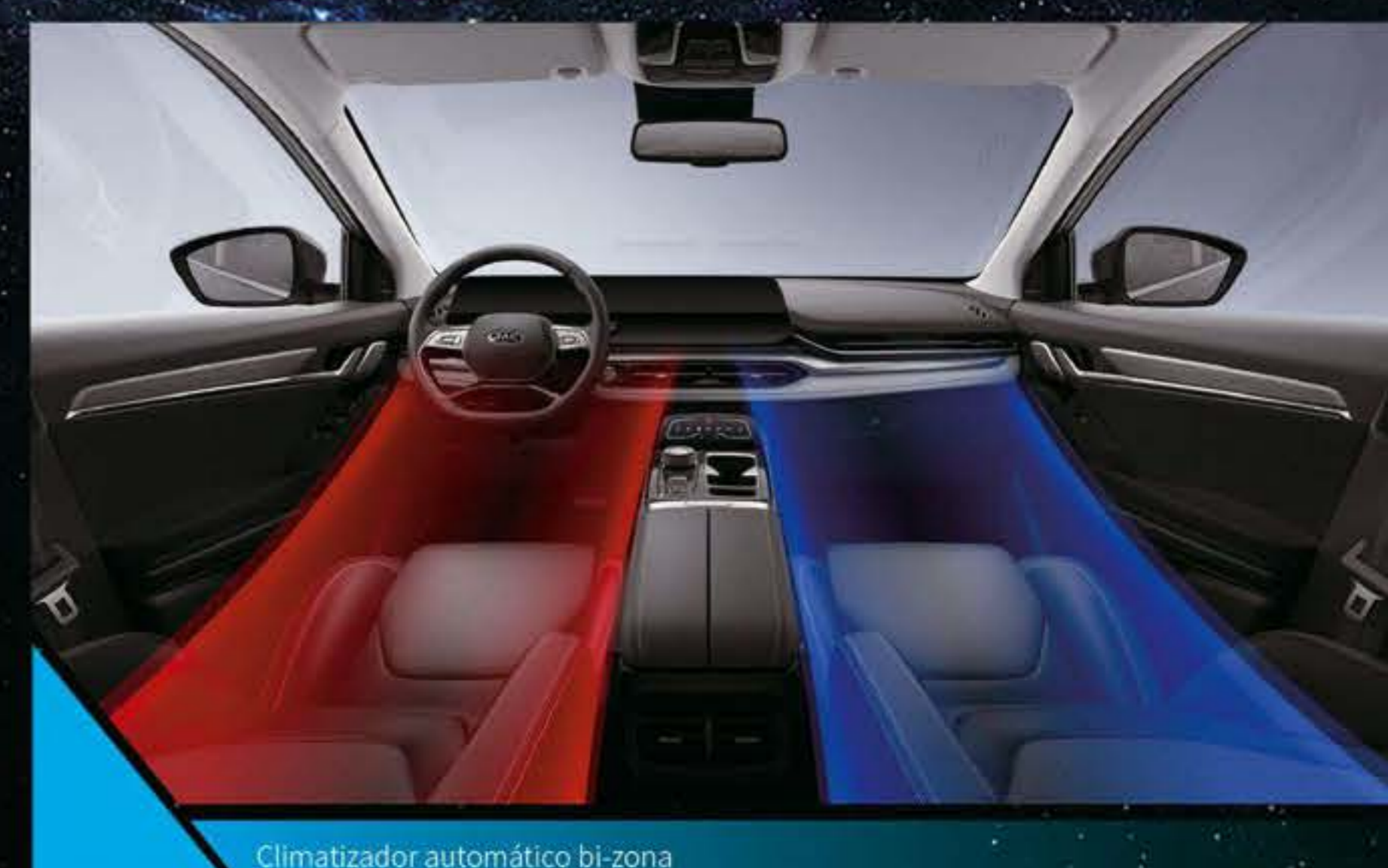
Climatizador automático bi-zona