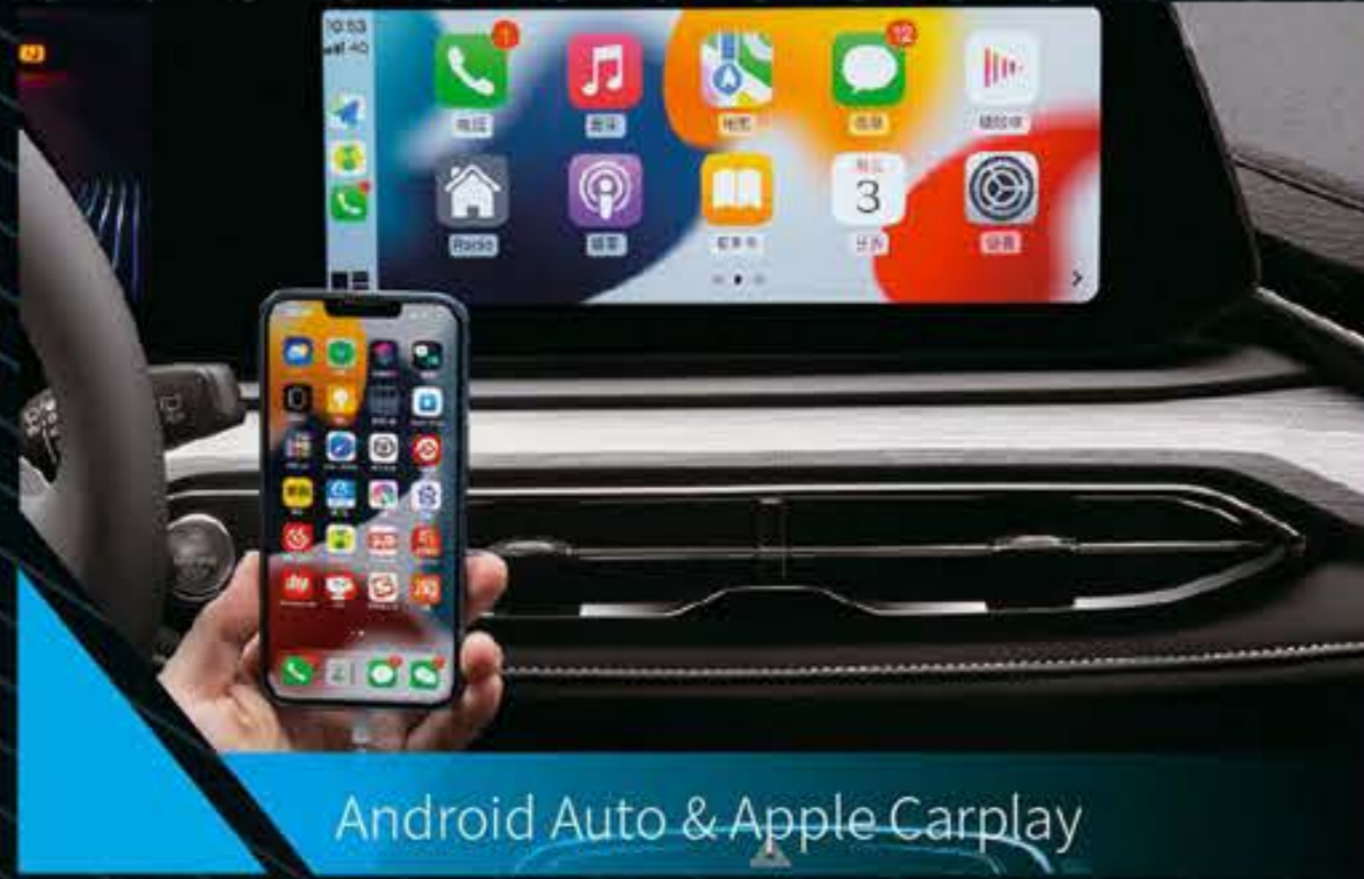
Android Auto & Apple Carplay