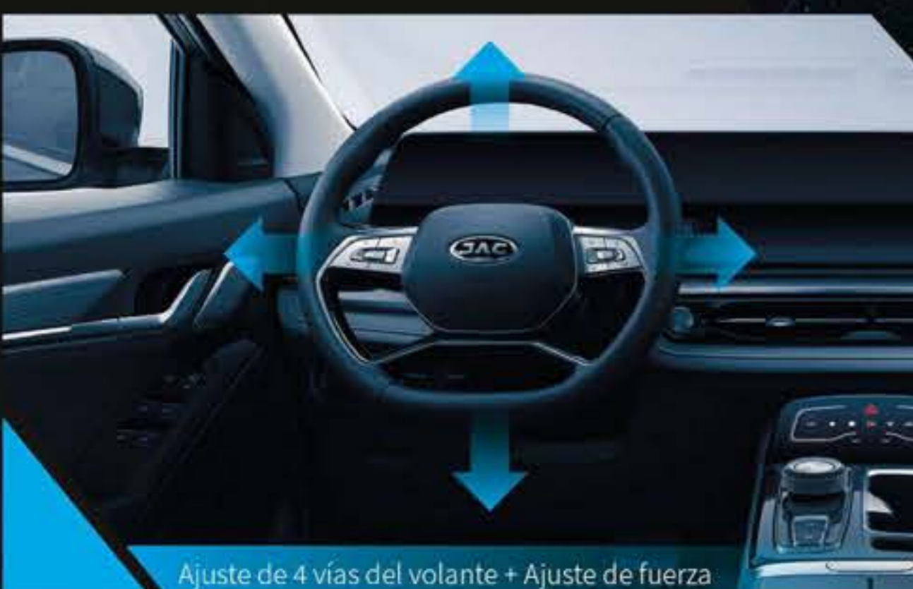
Ajuste de 4 vías del volante + Ajuste de fuerza