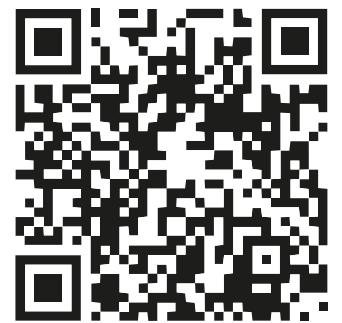
Sistema de captación de lluvia en una primaria

Donantes principales: Fundación EMPower, Terra Tech Förderprojekte e.V, Vámonos Riendo Mezcal y S.A.C.R.E.D.