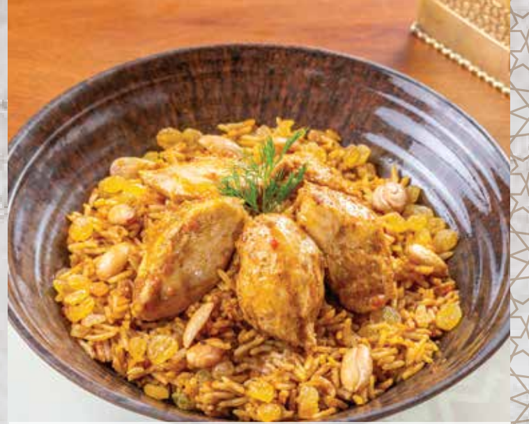
Chicken Biryani. 300.00 بيرياني بالفراخ (basmati rice with chicken breast and biryani sauce) (أرز بسمتي مع صدور الدجاج والتبلي وصلصة البيرياني)