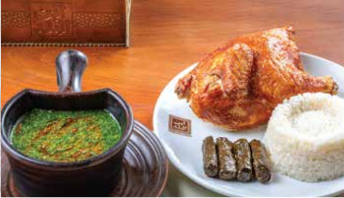
ملوخية بالفراخ . 265.00 (Mallow with Chicken (half roasted chicken in butter with mallow and white rice)) (نصف فرخة بالزبد مع ملوخية ابن البله وأرز أبيض)