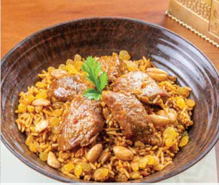
Beef Biryani. 395.00 بيرياني باللحم (basmati rice with meat and biryani sauce) (أرز بسمتي مع مكعبات اللحم وصلصة البيرياني)