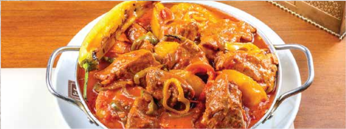
Meat with Onions and Potatoes