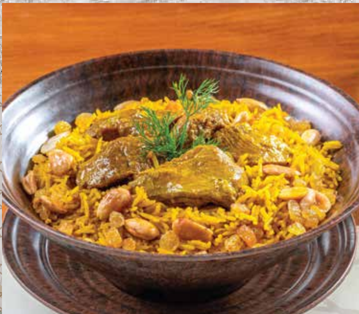
Lamb Meat Kabsah. 395.00 كبسة لحم ضاني (basmati rice with Lamb meat and kabsah spices) (أرز بسمتي مع بهارات الكبسة ومكعبات اللحم الضاني)