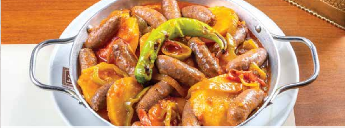
Potato With Sausage