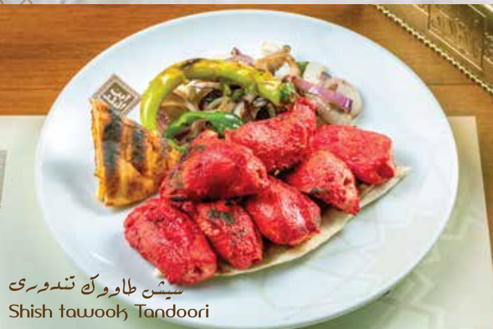
شيش طاووك تندوري Shish tawook Tandoori