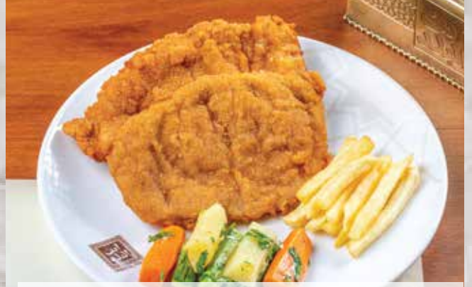
فراخ بانينة . 285.00 (Chicken Pane (served with French fries and steamed vegetables)) (تقدم مع البطاطس المحمرة والخضار المسلوق)