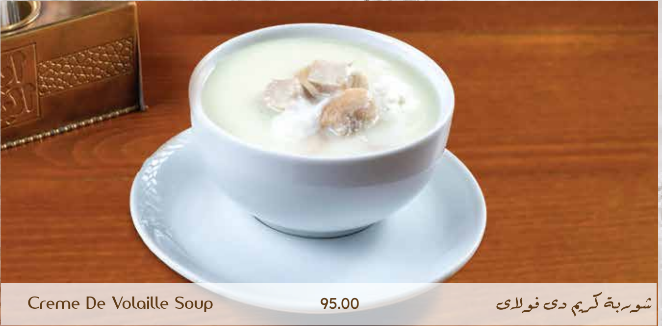
Creme De Volaille Soup