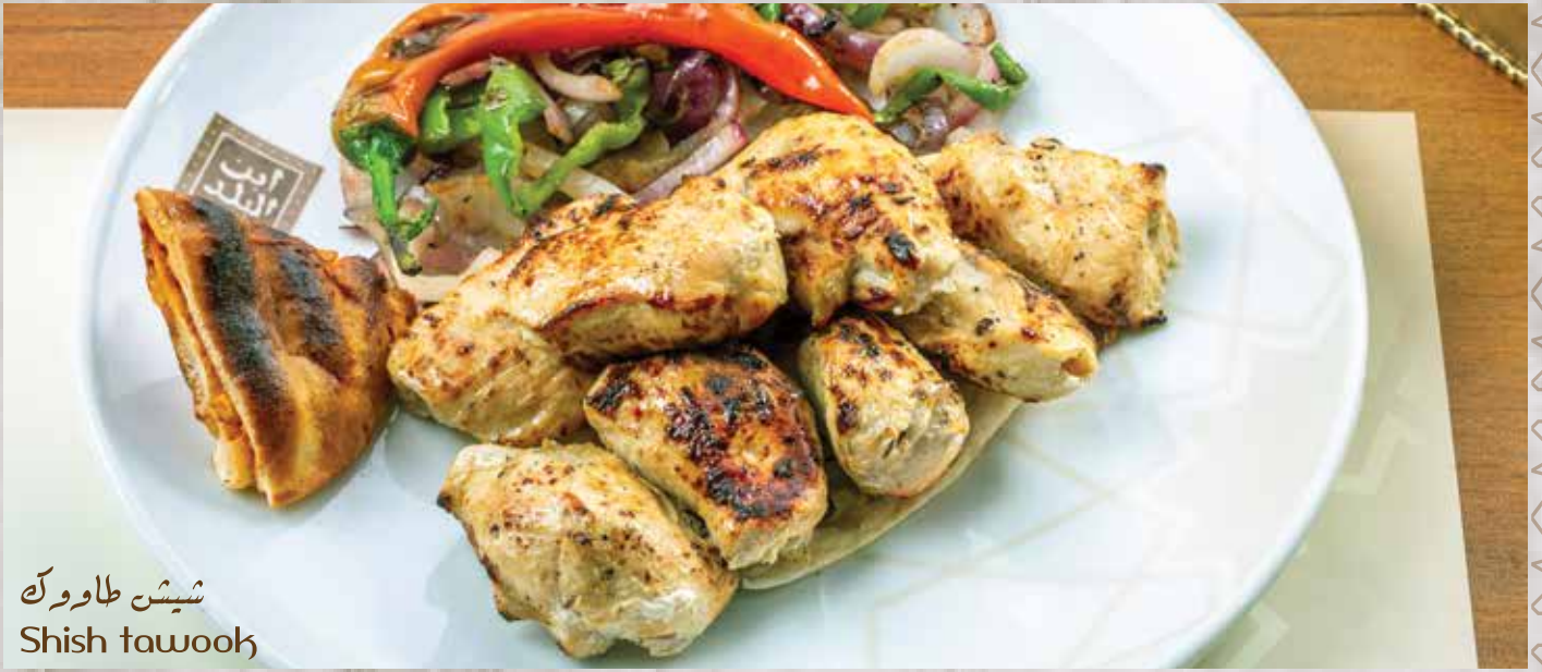
شيش طاووك Shish tawook