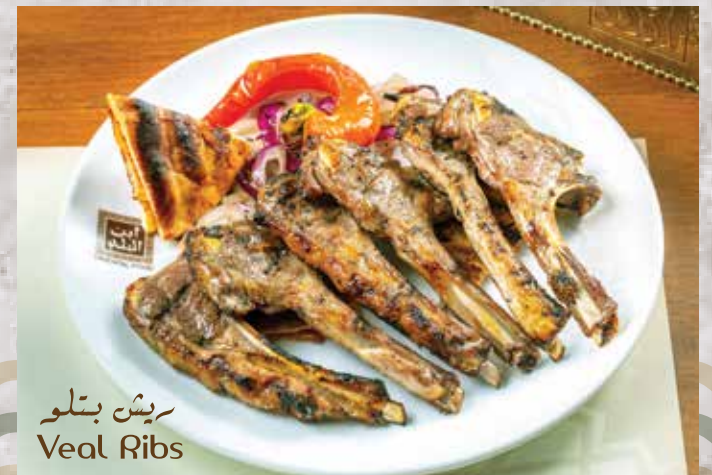
ريش بتلو Veal Ribs