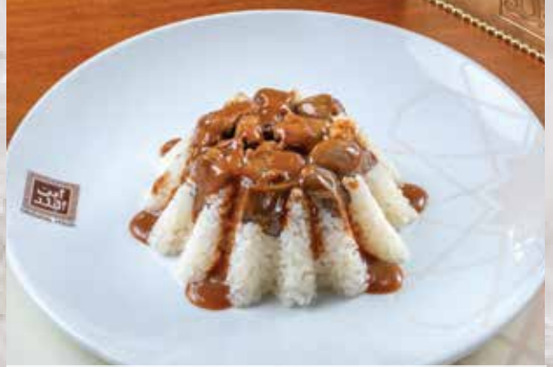
ارز بالكاري (ارز بسمتي مع كاري مدراس المشهور) Rice with Curry (basmati rice with curry medras)