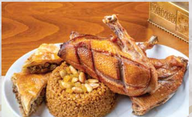
طبق بط محمر . 410.00 (Roasted Duck (half roasted duck in oven with mixture rice & rokak slices)) (نصف بطه محمر بالفرن مع الأرز بالخلطة ورقاق بادي باللحمة)