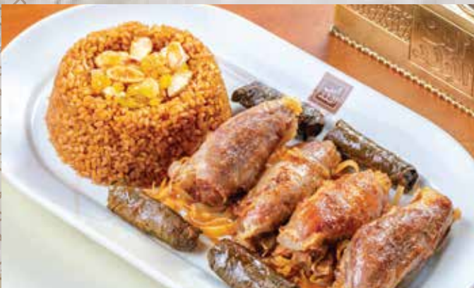
موزة مشوية / محمرة (بتلو) . 575.00 (Roasted Veal Mouza (with mixture rice)) (مع أرز خلطة)