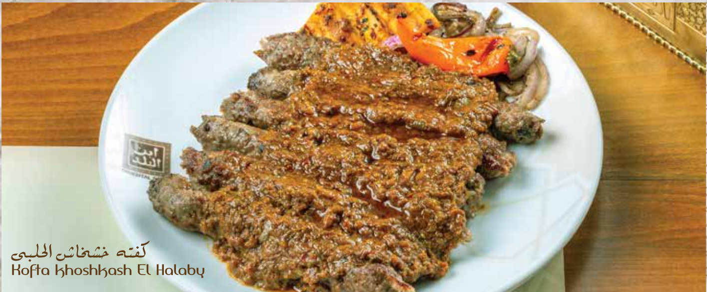
كفته خشخاش الحلبي Kofta khoshkash El Halaby