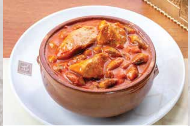
175.00 طاجن بامية باللحم Tapine Okra with meat

طاجن مسقعة تركي ..... 150.00 طاجن ارز بالكلاوي ..... 165.00 Tapine Turkish Musakaa ..... 150.00 Tapine rice with Kalaouy ..... 165.00