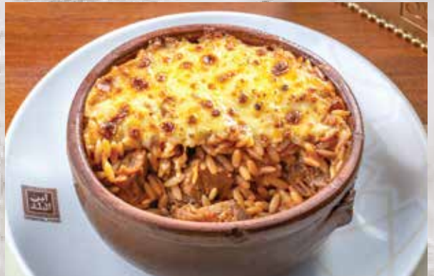
145.00 طاجن لسان عصفور باللحم Tapine Lesan Asfour with meat