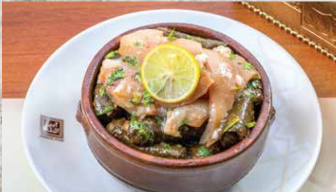
320.00 طاجن ورق عنب بالكوارع Tapine Vine Leaves with Shin Beef

طاجن مسقعة تركي ..... 150.00 طاجن ارز بالكلاوي ..... 165.00 Tapine Turkish Musakaa ..... 150.00 Tapine rice with Kalaouy ..... 165.00