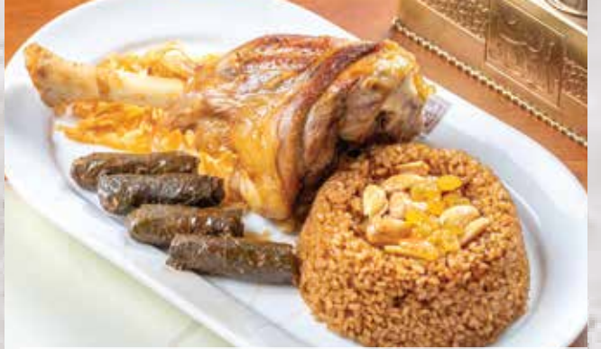
موزة مشوية / محمرة (ضانى) . 590.00 (Grilled Veal Lamb Meat (with Khalta Rice)) (مع أرز خلطة)