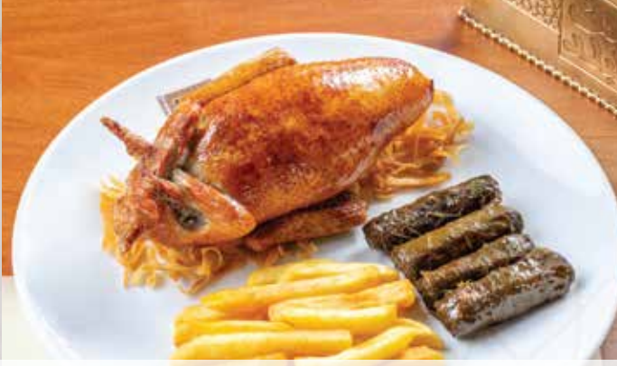
حمام محشى (ارز / فريكة) . 200.00 (Stuffed Pigeon (Rice / Fereeh (pigeon with ferrek, French fries and vermicelli)) (حمام مع خلطة الفريك البلدى مع البطاطس المحمرة)