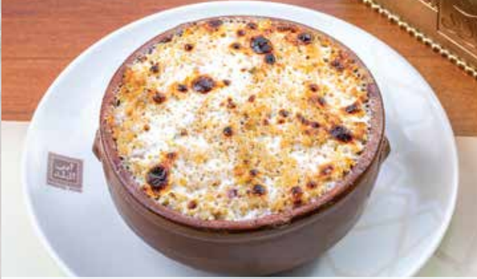
365.00 طاجن فريك / ارز بالممام المخلو Tapine rice/ fareek with boneless Pigeon