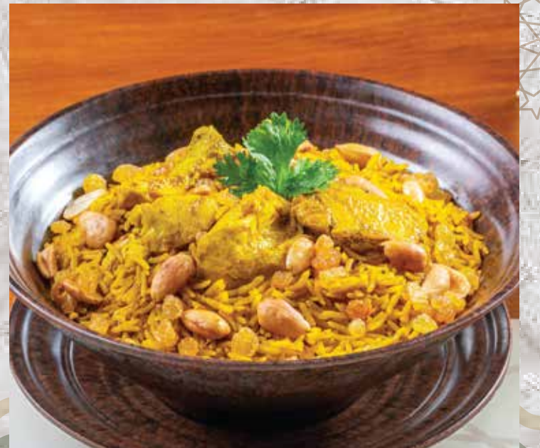
Chicken Kabsah. 300.00 كبسة فراخ (basmati rice with chicken and kabsah spices) (أرز بسمتي مع بهارات الكبسة ومكعبات الدجاج)