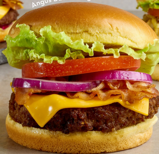
Angus Bacon Burger