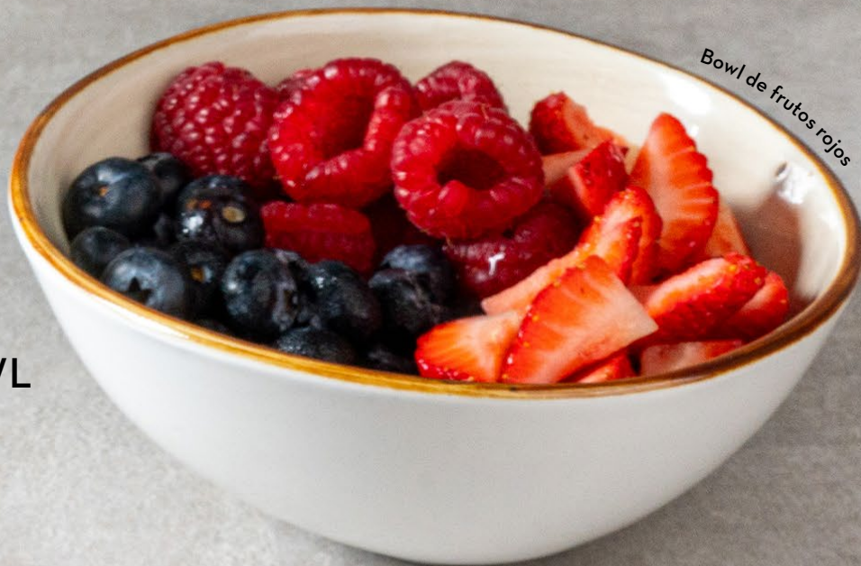
Bowl de frutos rojos