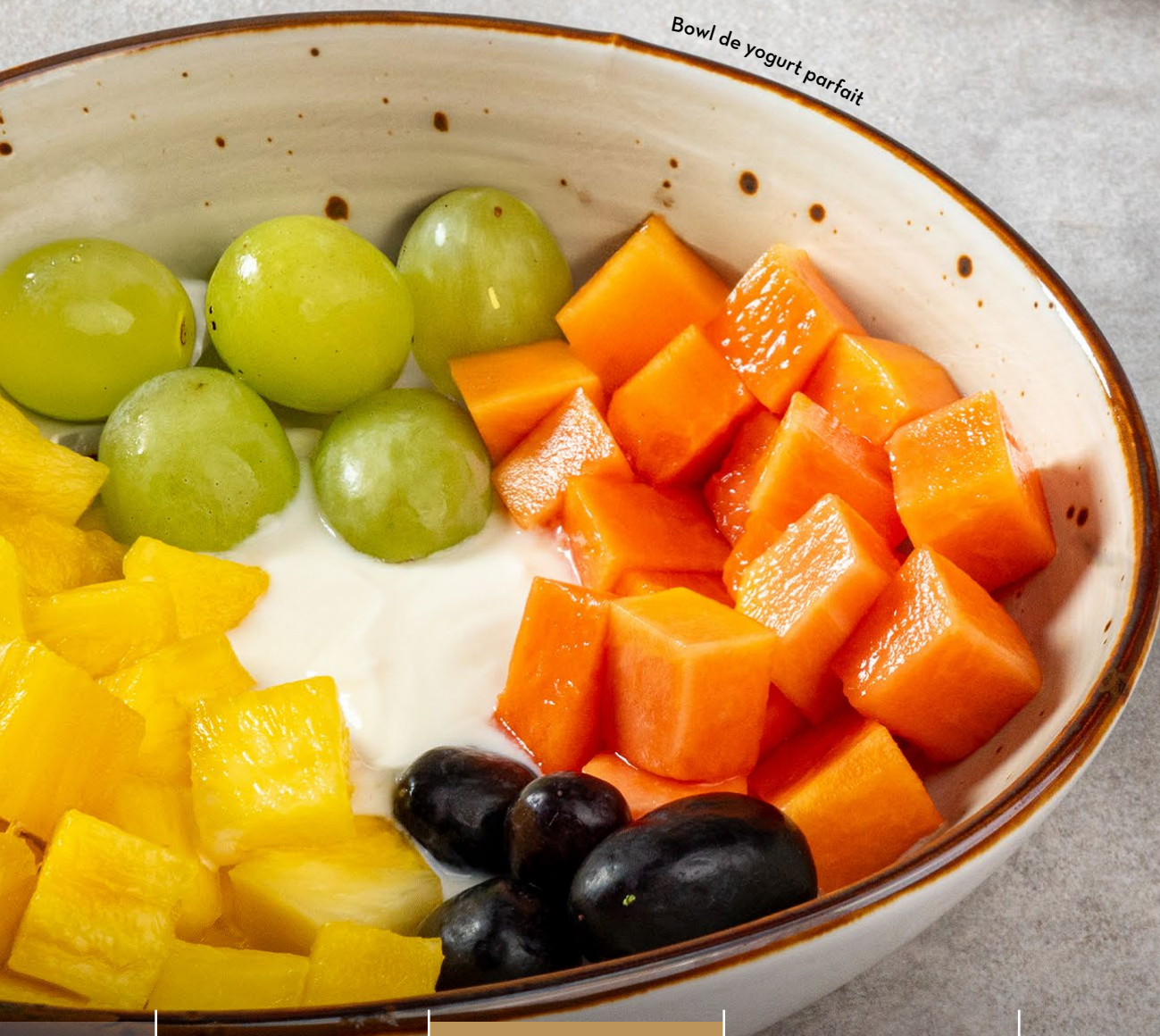
Bowl de yogurt parfait