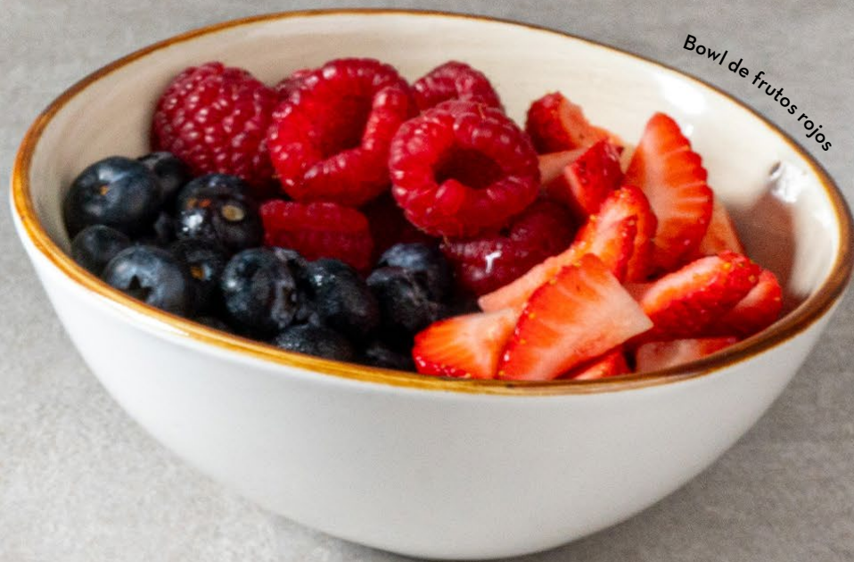
Bowl de frutos rojos