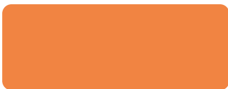
6710 LARANJA SEGURANÇA NARANJA SEGURIDAD / Munsell 2,5YR6/14