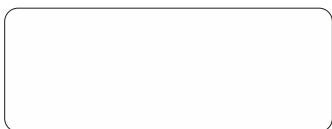
1000 BRANCO FOSCO BRANCO MATE