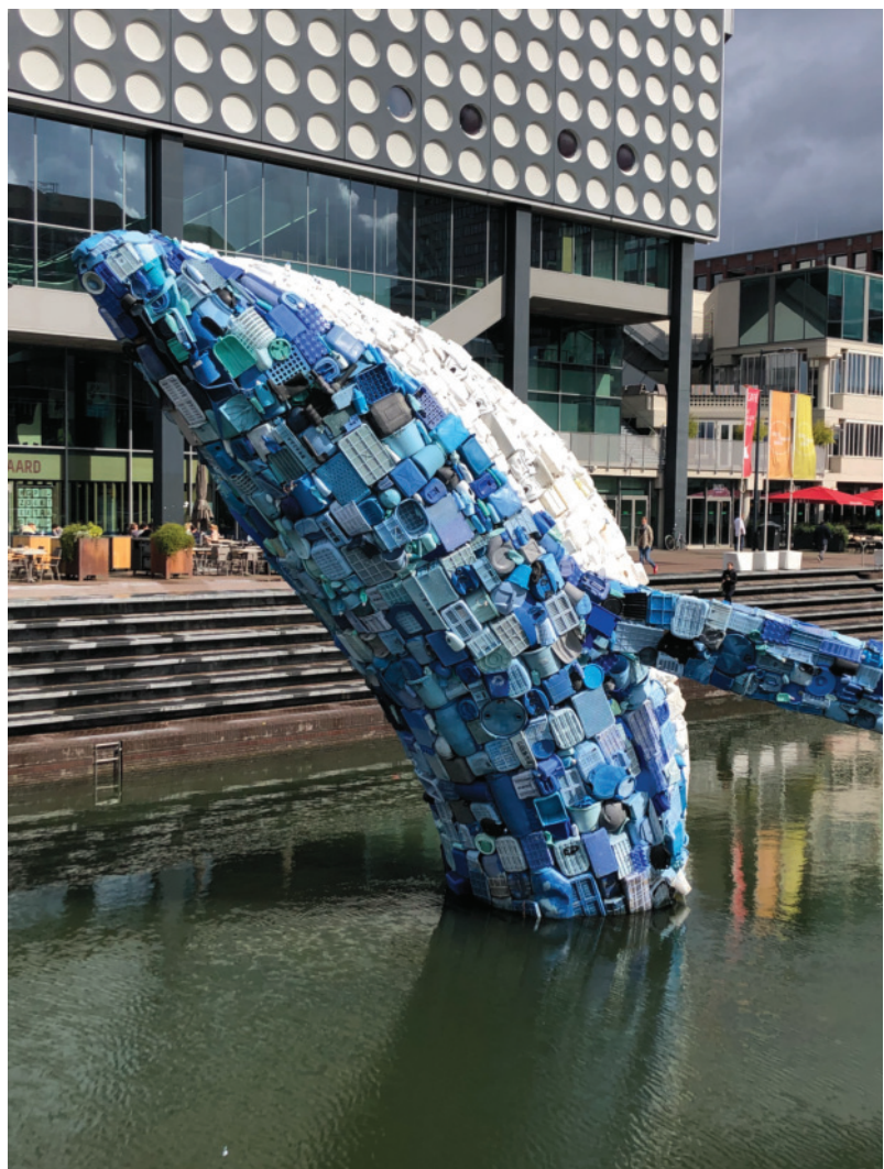
Foto von Valentina Friederichs; zeigt eine Skulptur über Meeresverschmutzung in Amsterdam

Für Frieden, für Gerechtigkeit und für unser aller Zukunft.