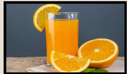
zumo de naranja