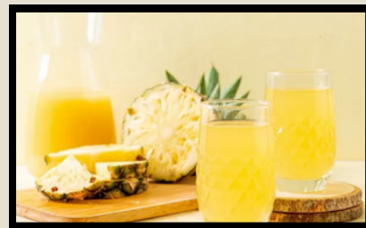
Jugo de piña